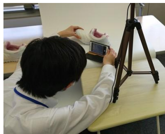
"商品の写真撮影をする様子"

発達支援の学習塾アットスクール（草津市大路）が3月10日、就労支援のためにネットショップ「キャリアアวิลYahoo!店」をオープンした。（びわ湖大津経済新聞）