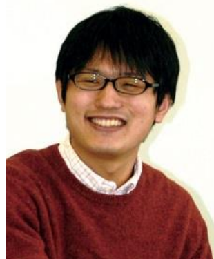
聖泉大学准教授/臨床心理士